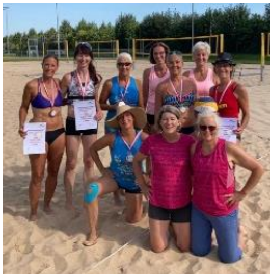
Hessische Meisterschaften Ü43